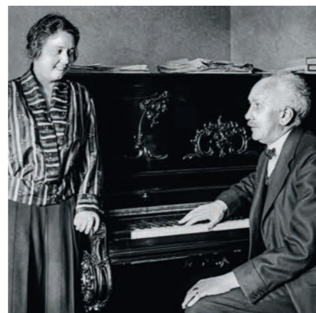
Richard Strauss mit der Sopranistin Elisabeth Schumann