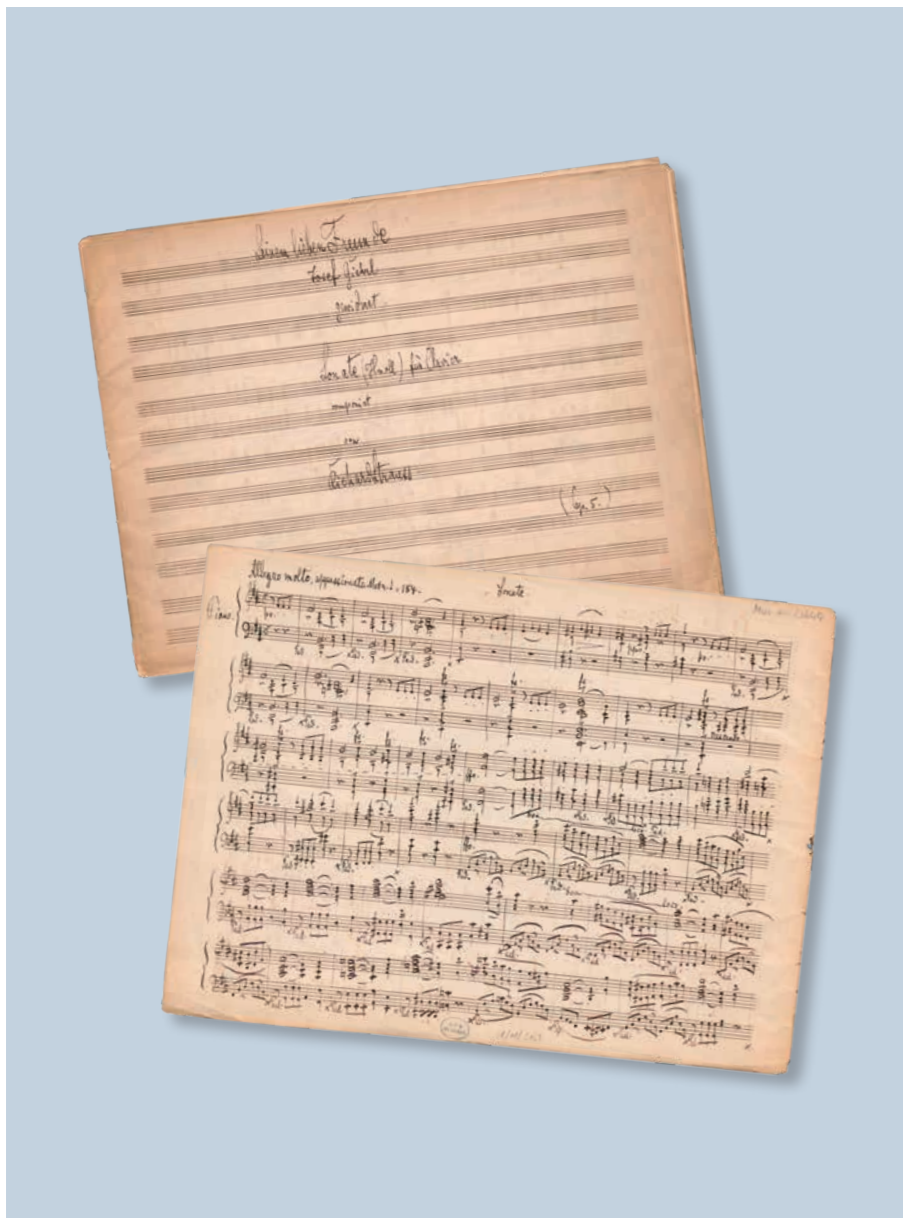
Klaviersonate h-moll op. 5, Autograph

Richard Strauss ist der letzte große Romantiker des 20. Jahrhunderts und bis heute einer der meistgespielten Komponisten weltweit. Im krassen Gegensatz zu seinem künstlerischen Rang steht oft die mangelhafte Qualität des bisher verfügbaren Notenmaterials. Die wichtigsten konzertanten und kammermusikalischen Werke legen wir in bewährter Urtext-Qualität – oft zum ersten Mal überhaupt – vor. Herausragende Künstler und Strauss-Interpreten unterstützen uns bei diesem spannenden Projekt.