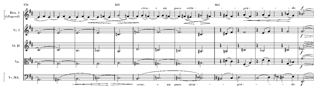
Notenbeispiel zu ALLEGRO NON TROPPO, T 456–468

103–104, Tutti: Brahms tilgte den zwischen den definitiven Takten 103 und 104 notierten Takt, siehe Notenbeispiel S. 220 und Editionsbericht , S. 269.